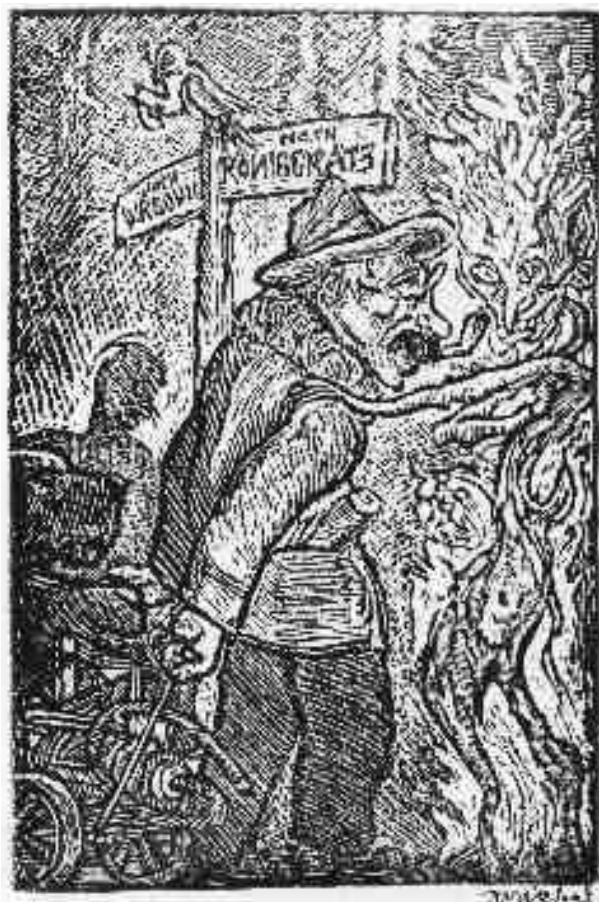
Josef Váchal. X2. 1932