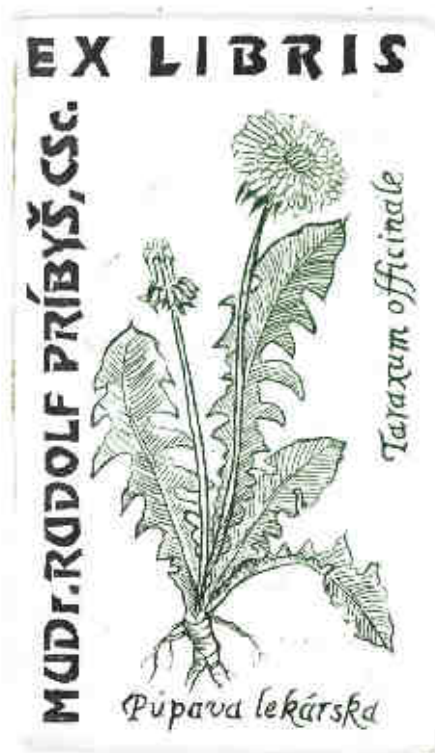
Oldřich Páleníček. C8+X3. 2003

Brožurka má 48 stran včetně obálky a byla vytištěna v Uherském Brodě v roce 2006 ve vydavatelství JASPIS.