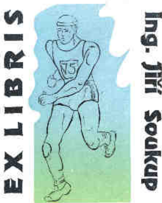
Oldřich Páleníček. C8+X3. 2003