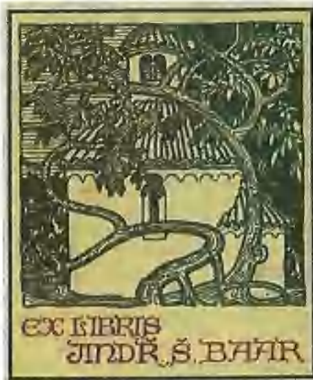
Oskar Fiala, P1, 1913, JVKCB

Postupující digitalizace sbírkových předmětů a přepis strojopisných karet do databáze umožňuje následně zveřejňovat