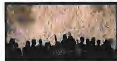
PF 2020 Planetárium Brno, P7, 2019

ročenku vytvořilo Planetárium Brno a luxusní, látkou potaženou novoročenku rozesílalo Národní divadlo. Znamé tváře využila značka Bohemia Sekt a Technické