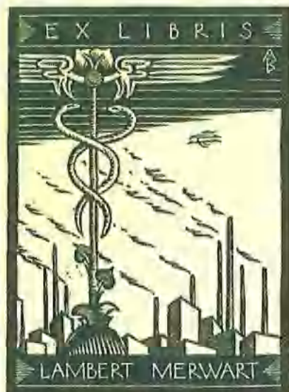
Antonín Burka, X2, 1923, JVKCB

nechybí na exlibris třecí miska odkazující na chemii a kniha, na níž je položena dubová větévka vztahující se k příjmení