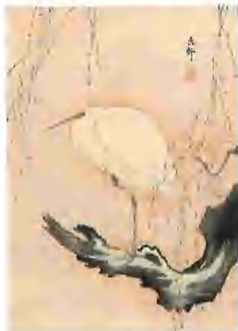
Ohara Koson, P2, 1937

Roku 1937 vyšel jako 96. titul edice Symposion tibetský román Mipam . V tiráži je uvedeno: Úprava vazby, titulního listu a ilustrací v textu provedeny byly podle čínských dřevorytů, zapůjčených k reprodukci láskavostí p. řed. Dra. K. Heraina Umělecko-průmyslovým museem v Praze . Ve skutečnosti se ovšem jednalo o umění japonské. Vazbu, titul a protititul zaujmají reprodukce