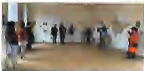
Zahájení výstavy v dobrušské tvrzi.

Jens Asmus je německý figurální malíř působící v Praze. Lze jej zařadit mezi tra-