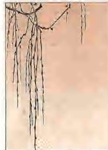
E X L I B R I S