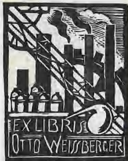
Neznámý autor, X3

byla vytisknuta na několika barevných odstínech papíru (zelený, šedý, červený). Značka je archivována v několika centrálních sbírkách (X2, 84:60 mm, 1921. RMT, KNM, GHMP). Frynta si objednal u Váchala poté ještě další exlibris čtvercového formátu zaplněné kromě