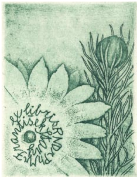
Hana Storchová, C3, 1990