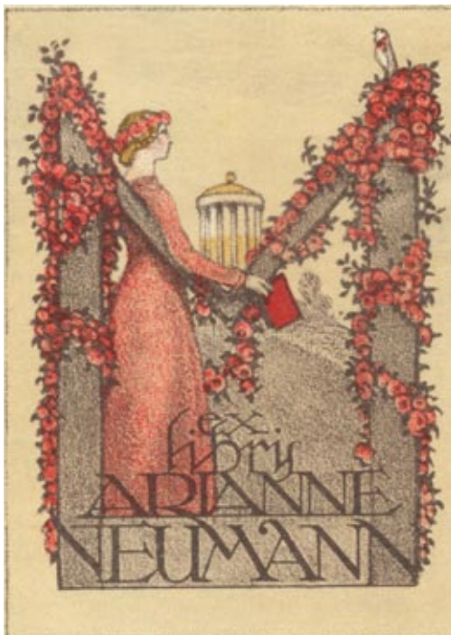
Hugo Steiner-Prag, L1, 1910