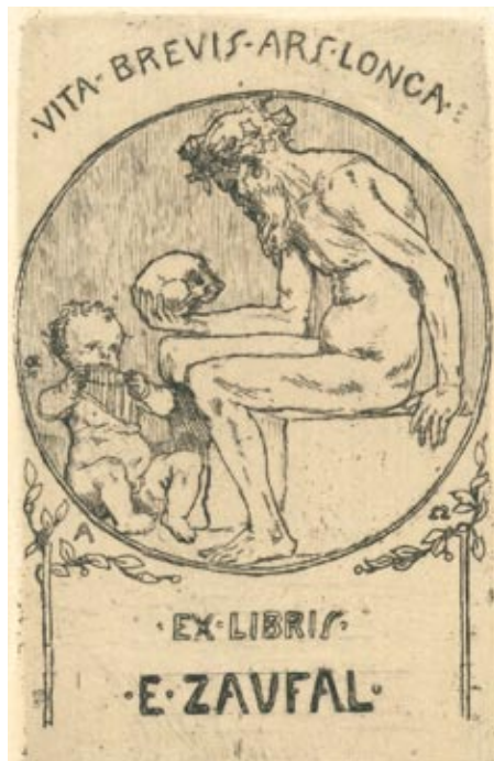
Emil Orlik, C3, 1898

V tvorbě exlibris měli na přelomu 19. a 20. století v rozvíjejícím se evropském sběratelském povědomí jednoznačně náskok před českými umělci především dva pražští tvůrci z německo-židovské kulturní enklávy: Emil Orlik (1870-1932) a Hugo Steiner-Prag (1880-1945). Pro