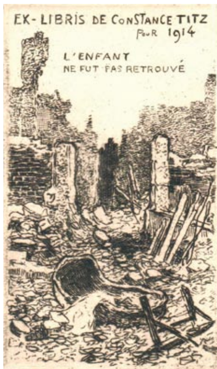
Louis Titz, C3, 1914

ve válce padlých, zmračených a raněných. Pro výstavu se podařilo shromáždit 17 exlibris vytvořených umělci z celé Evropy. (Výstava byla pojata ve větší šíři a doplněna dobovými dokumenty.) Na exlibris jsou nejrůznější očekávatelné