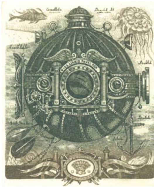
Milan Bauer, Ex libris Pavel Pich, Batyskaf, C3, 2014