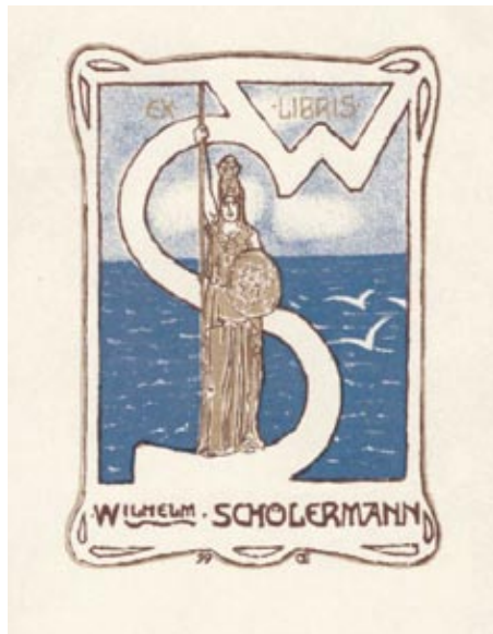
Emil Orlik, L1, 1899