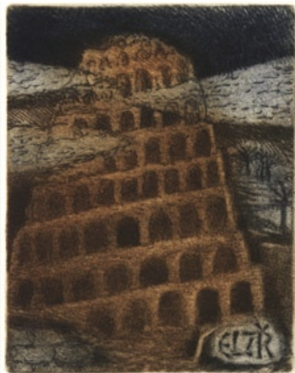
Lubomír Netušil, C3/3, 2005