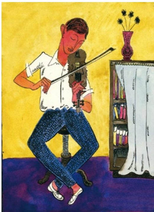
Jaroslav Hořánek, studie k nepoužité ilustraci pro knihu V. Čtvrťka Chlapec s prakem. Praha, SNDK, 1961