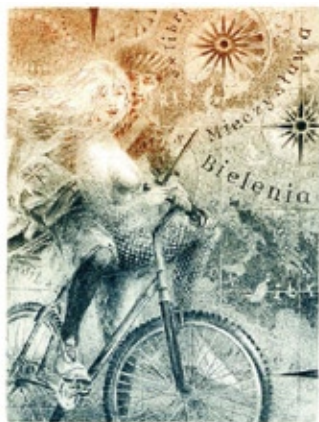
Hanna T. Głowacka, C4+C5/2, 2014

Pokud mluvíme o objednávaných exlibris pro konkrétní osoby, nelze se nezamyslet nad značkami, které byly vystaveny v Gliwické knihovně. Myslím, že během několika let budou mít znalci zabývající se exlibris velký problém zjistit, komu byly jednotlivé knižní značky určeny a zda někdo takový existoval. Mezi desítkami značek existují bohužel takové, kde autoři nepochopili význam, genezi a určení exlibris a navíc si pletou pojmy – exlibris a miniaturní grafika. Zjišťuji také další nepříjemnou skutečnost, a to valící se vlny pseudoexlibris. Tyto značky jsme