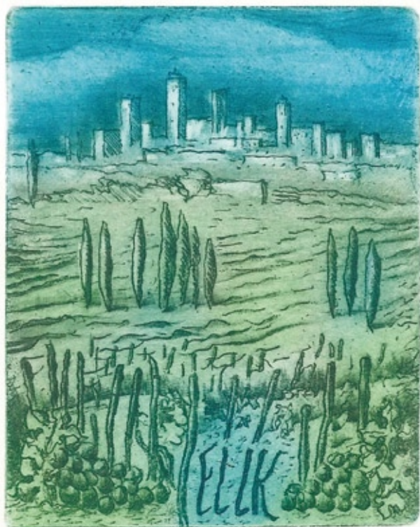
Lubomír Netušil, C6+C7, 2013