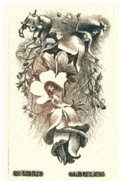
Robert E, Baramow, algrafie, 2014

tvůrce, kteří tvořili či tvoří umělecky hodnotné lístky, sloužící bibliofilům k označování knih. Zabývá se rovněž mapováním a zaznamenáváním exlibrisových