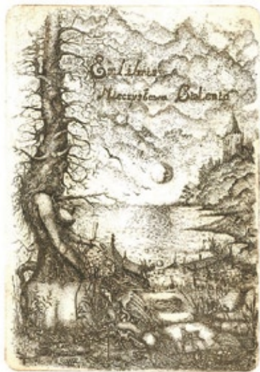
Piotr KirkiHo, C5/2, 2004