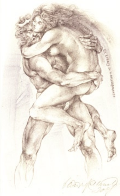
Oldřich Kulhánek, L1/2, 2008

Max Švabinský, jsme neměli krásnější platidlo.