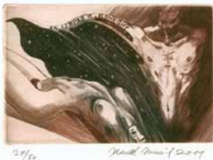
Karel Musil, C4, 2011

Malý prostor dovolil vystavit pouze 7 panelů, tj. 42 exlibris. Návštěvníky zaujal především velmi dobře a originálně zpracovaný cyklus s názvem Jazz. Zbývající exlibris, podle požadavků majitelů, ukázala na věčně trvající téma vztahů mezi mužem a ženou s důrazem na sexualitu. Také tradiční otázky lidského bytí a vztah k přírodě našly svoje uplatnění.