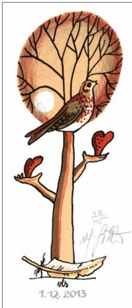
Vlastimil Sobota, L1/5, 2013

barevná, neboť barevnost a optimismus k jeho tvorbě patří. To se projevuje zejména v grafické tvorbě, kde tištěná barevnost má nádech olejů Kamila Lhotáka.