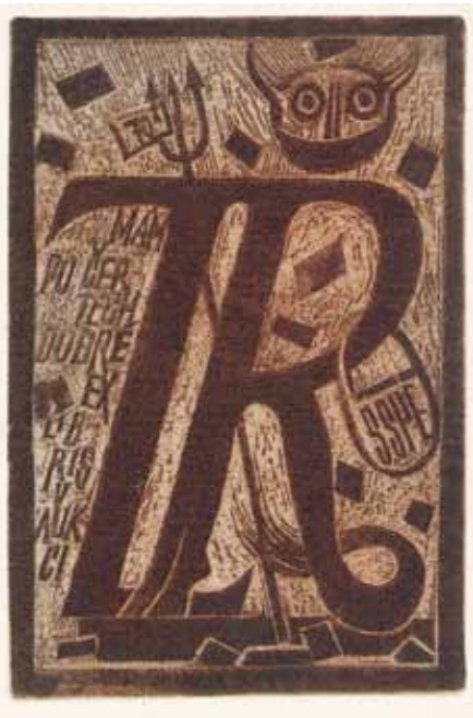
Lubomír Netušil, C3, 2013

i jinde. Publikační činnost o jeho lásce – grafice a exlibris znáte z Knižní značky a ze Sborníků. Pokud ne, můžete se podívat na jeho webové stránky http://exlibris-archa.webnode.cz , kde to má srovnáno s pečlivostí toho, který se pohyboval ve světě měř a vah. Jsou tam i dokumen-