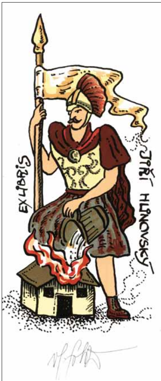
Vlastimil Sobota, L1/5, 148:72, 2013