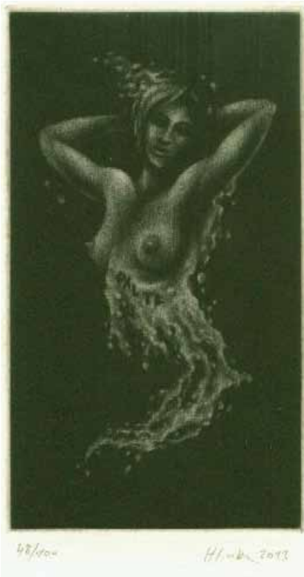
Miroslav Hlinka, C7, 2013

Přestože zájem našich sběratelů je soustředěn hlavně na tvorbu umělců našich,