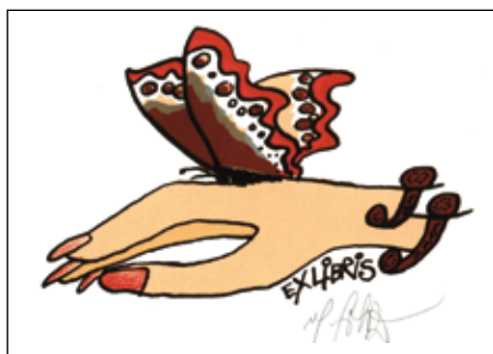
Vlastimil Sobotu, L1/5, 2013

Touto parafrází na americký romantický film šedesátých let minulého stole-