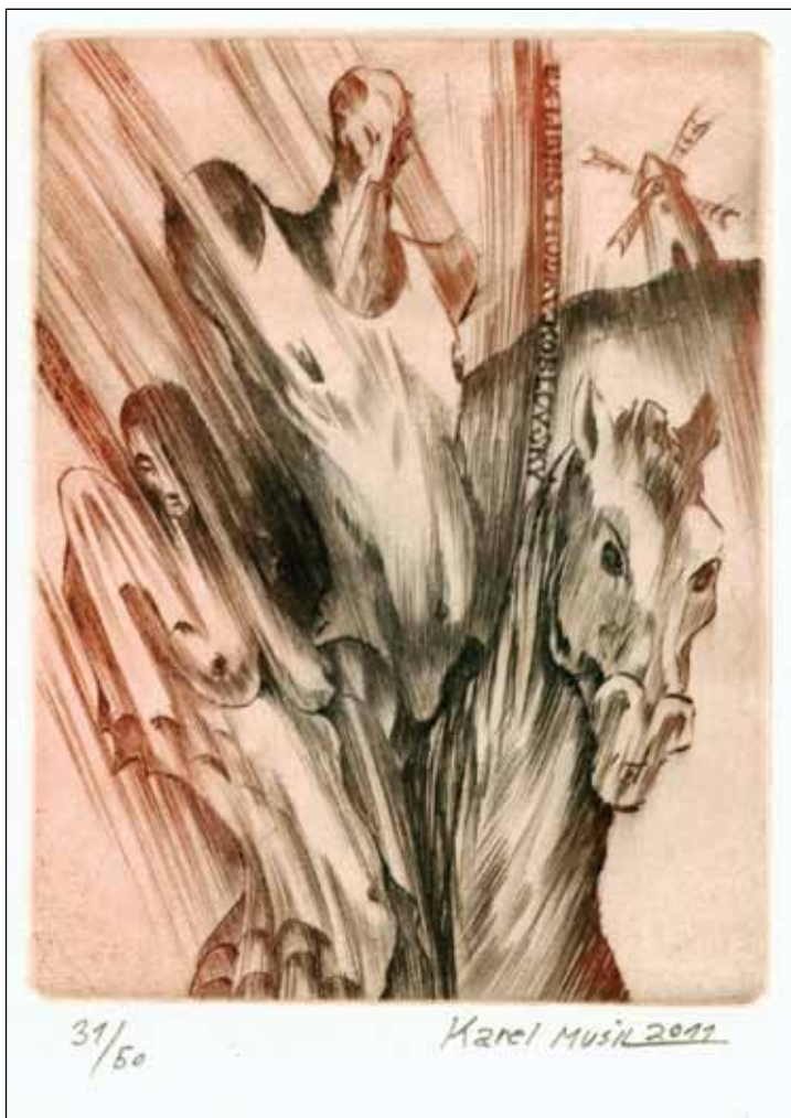
Karel Musil, C4, 118:88, 2011