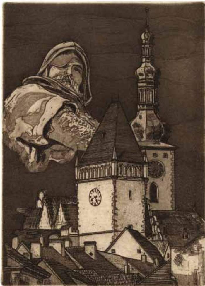
Miroslav Petřík, Žižkův Tábor, C3+C5, 162:116, 2013