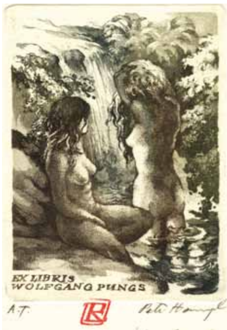
Petr Hampl, C3, 1991

Skromnost a velké malířské a grafické umění charakterizují našeho dlouholetého člena Petra Aloise Hampla. Je pře-