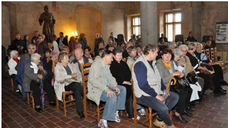
Zahájení sjezdu v Husitském muzeu v Táboře