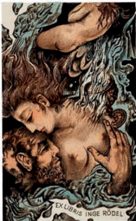
Bohumil Krátký, L1/3, 1983

léta po roce 1968. Tehdy se angažoval v demokratizačním procesu, stal