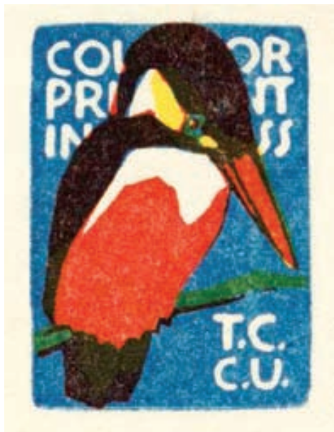
Vojtěch Preissig, X2/4, 1915

( http://muzeum3000.nm.cz/zajimavosti/grafik-a-bojovnik-za-svobodu-vojtech-preissig ).