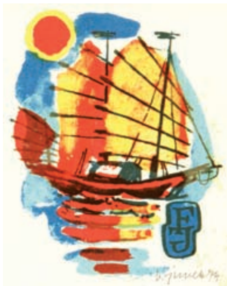
Václav Junek, L1/4, 1974

VÁCLAV JUNEK , malíř, grafik a ilustrátor dětských knih a učebnic, se narodil 16. 8. 1913 v Kladně a zemřel 29. 1. 1976 v Praze. Vyučil se sazečem v tiskárně J. Šnajdra v Kladně a pracoval jako typograf-sazeč. Onemocněl však otravou olovem a musel