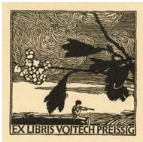
Vojtěch Preissig, X2, 1925

razení v textu, úvodní text Karel Dyrynk. Tyto publikace jsou těžko dostupné, zejména pokud se týká kompletnosti příloh.