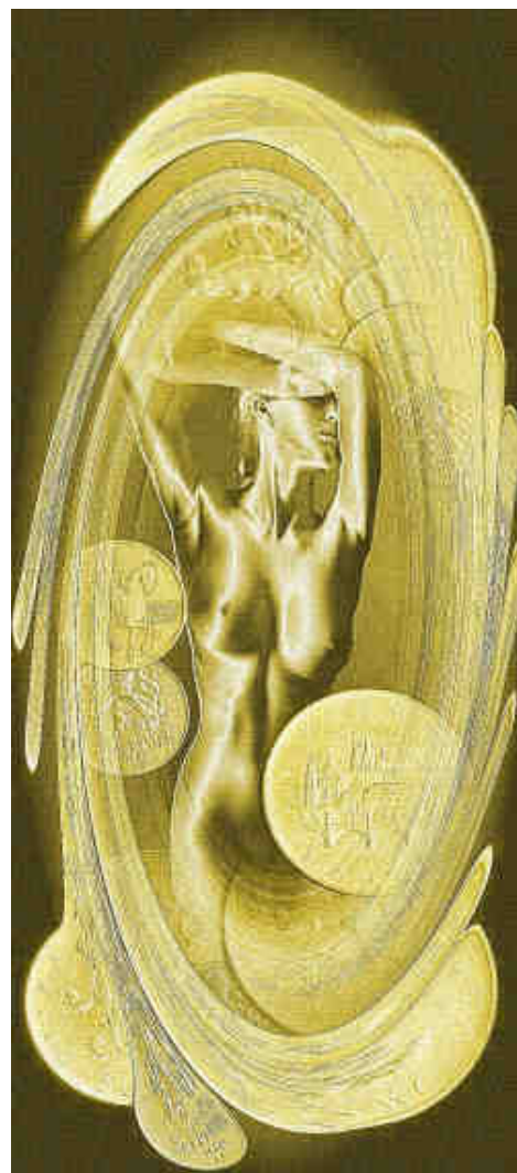
Jitka Roubalová. CGD. 2005