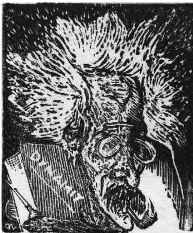
Josef Váchal. Autoportrét