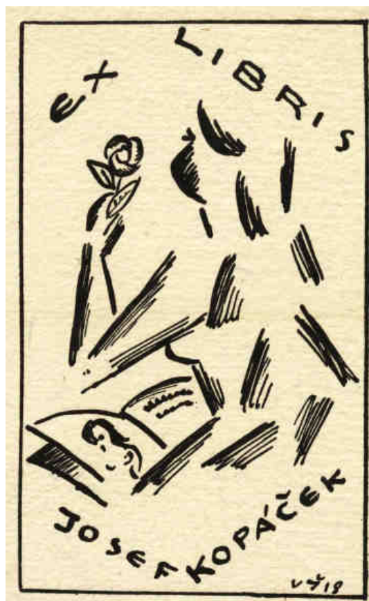
Václav Špála. P1 .1918